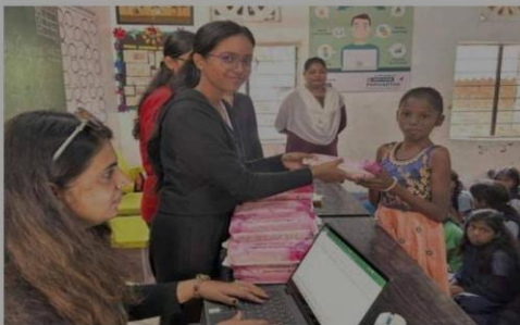
Below: Sanitary napkins being distributed to girls at the Ashram school-cum-hostel.

provides us with resources, mentorship for Rotaract events." They have an inspiring motto, "Learn, Change and Grow".