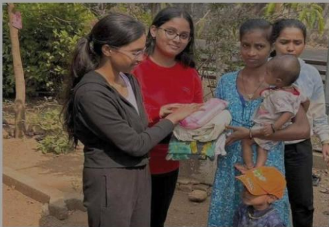
Above: Rotaractors give sparsely-used clothes and a sanitary napkin pack to a family in Lalthane village.

Though this community-based club was chartered in 1999, "it could sustain itself only for a few years... after a gap, the club was revived in 2015-16, and now we are going steady," she said. With 31 members from diverse professions including doctors, financial analysts, researchers, businessmen and college students, "we are supported by our parent Rotary who